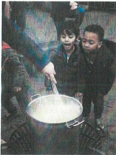
Abb. 3: Zwei kleine Gourmets bewerten die auf dem Lagerfeuer gekochte Gemüsesuppe.