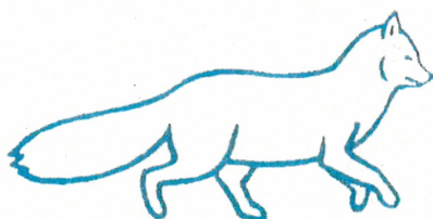
Abb. 1: Der Polarfuchs alias KLIMAfuchs.

Symbolfigur des Projektes ist der Polarfuchs, der laut Weltnaturschutzunion zu den zehn am meisten vom Klimawandel betroffenen Tieren weltweit zählt. Damit