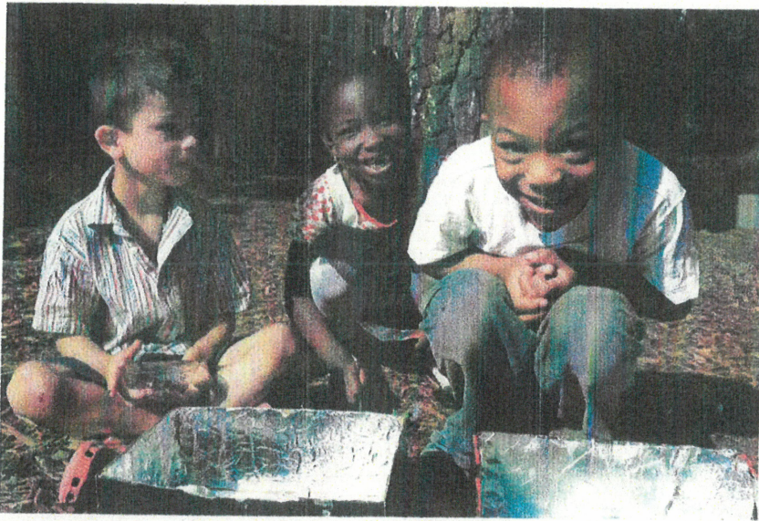
Abb. 2: Mit selbst gebauten Solaröfen die Kraft der Sonne erleben.

Konsumverhalten, das Klima, aber nicht zuletzt auch das Miteinander und Fragen der globalen Gerechtigkeit sind weltumspannende Themenfelder, in die die KLIMAFUCHS-Kinder langsam aber stetig hineinwachsen.