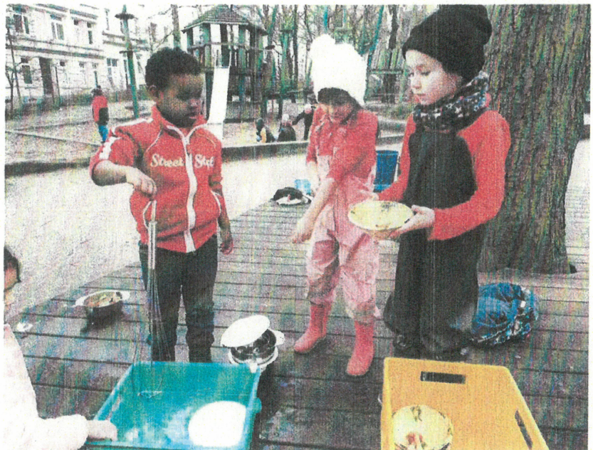
Abb. 4: Abwaschprofis bei der Arbeit.

wird anstatt die Fenster zu kippen und, dass die Heizung beim Lüften nicht und im Tagesverlauf nur auf niedriger Stufe läuft. So wollen sie unnötigen Energieverbrauch vermeiden.